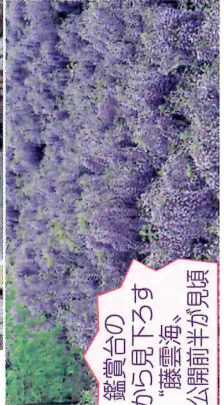
鑑賞の上から見下ろす「藤雲海」一般公開前半が見頃