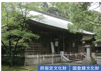
府指定文化財 国登録文化財